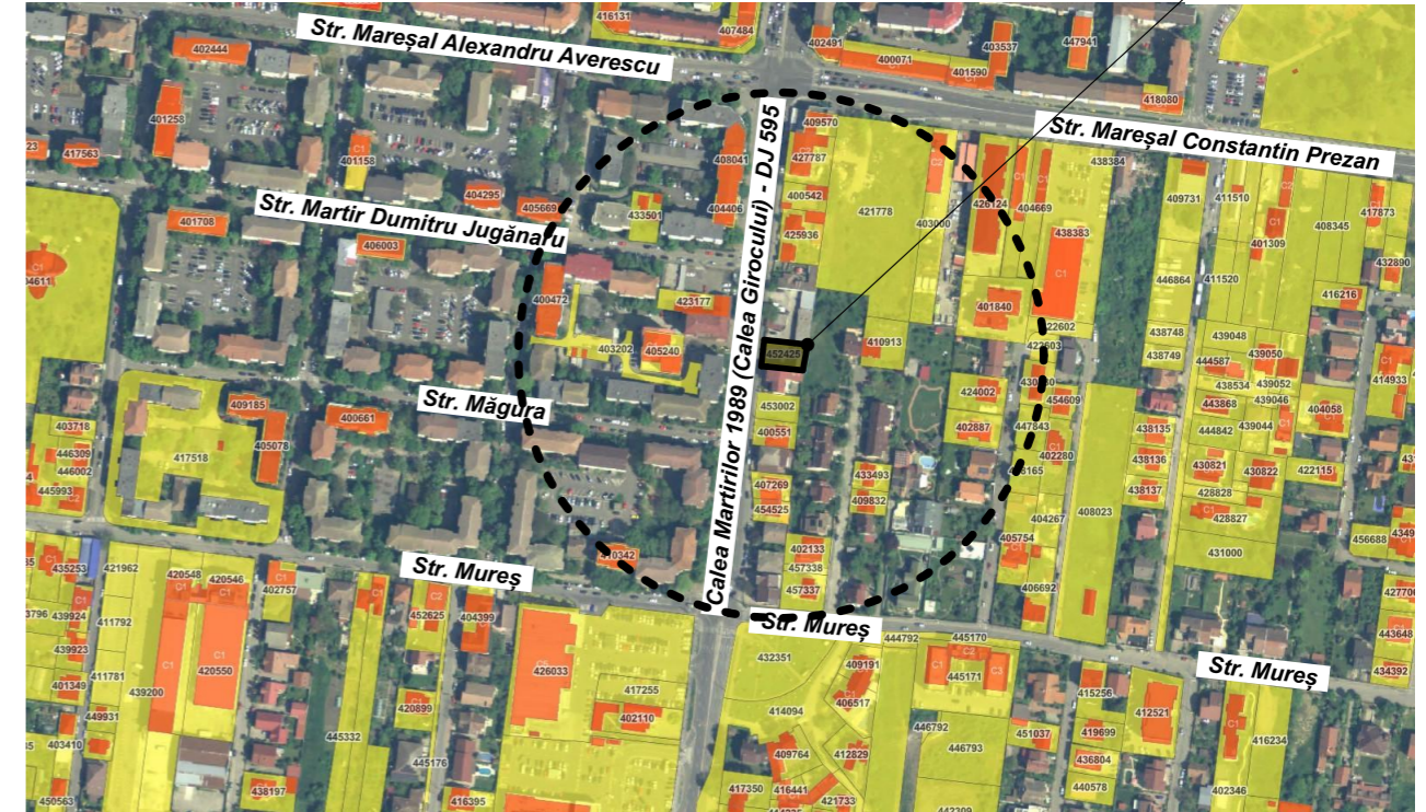
Încadrare în zonă - suport baza de date ANCI, sc. 1:5.000

NOTĂ: ACEST PROIECT ȘI INFORMAȚIILE CUPRINSE ÎN EL NU POT FI COPIATE, REPRODUSE SAU UTILIZATE, PARȚIAL SAU ÎN ÎNTREGIME DECAT CU ACORDUL SCRIS AL "3d archiDraw srl" ȘI NU VOR FI FOLOSITE ÎN ALT SCOP DECAT CEL PENTRU CARE AU FOST ELABORATE